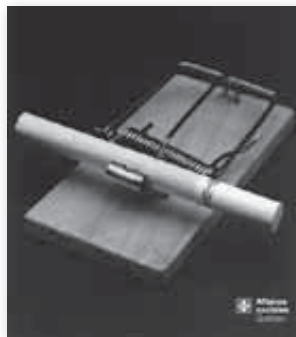
Cigarrillos: una trampa peligrosa

A mediados de la década de 1970, el Primer Ministro Pierre Trudeau inició controles de salarios y de precios, mientras el aumento del precio del petróleo aminoraba las economías de todo el mundo y persistían la inflación y el desempleo. En 1977 se aprobaron cambios en la Ley federal y provincial sobre arreglos